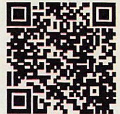
連絡メール2 保護者登録