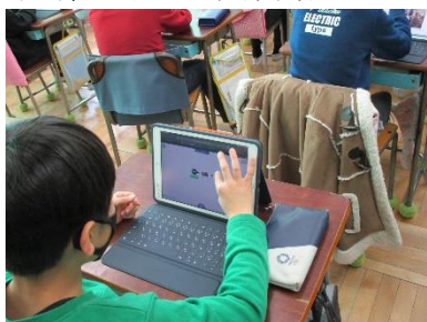
i P a dを積極的に活用しています。

学校公開も、保護者会も緊急事態宣言期間及びコロナウイルス感染症感染拡大により、変更する場合がありますので、ご理解ください。